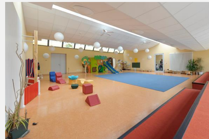
Kita „Stepping Stones“