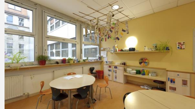
Impressionen aus der Kita „Stepping Stones“