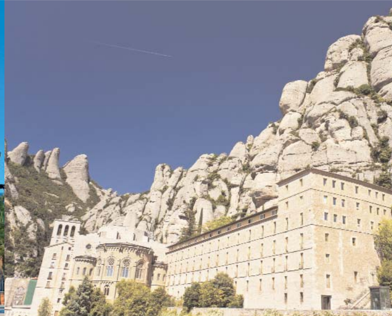
Alle Bilder dieses Folders sind urheberrechtlich geschützt.