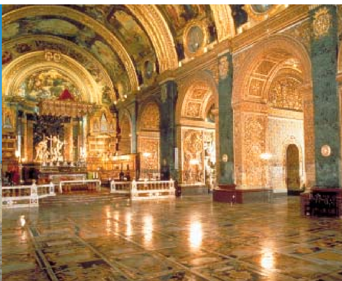
Alle Bilder dieses Folders sind urheberrechtlich geschützt.

Vorbei an der malerischen Buchten von Xlendi geht es zu einer weiteren Sehenswürdigkeit: Dem grandiosen megalithischen Tempel der Ggantija. Dieser Tempelkomplex ist noch vor den ägyptischen Pyramiden von einem unbekanntem Volk erbaut worden. Außerdem haben Sie Gelegenheit, sich die einheimische Handwerkskunst, wie z. B. die handgeklöpelte Spitze, ein wenig genauer anzusehen.